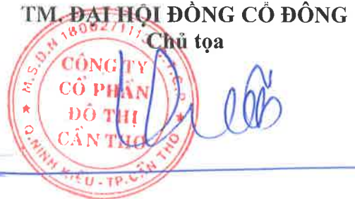
Lưu Việt Chiến